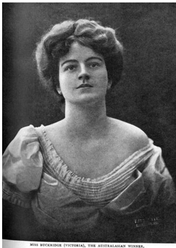
MISS BUCKRIDGE (VICTORIA), THE AUSTRALASIAN WINNER.