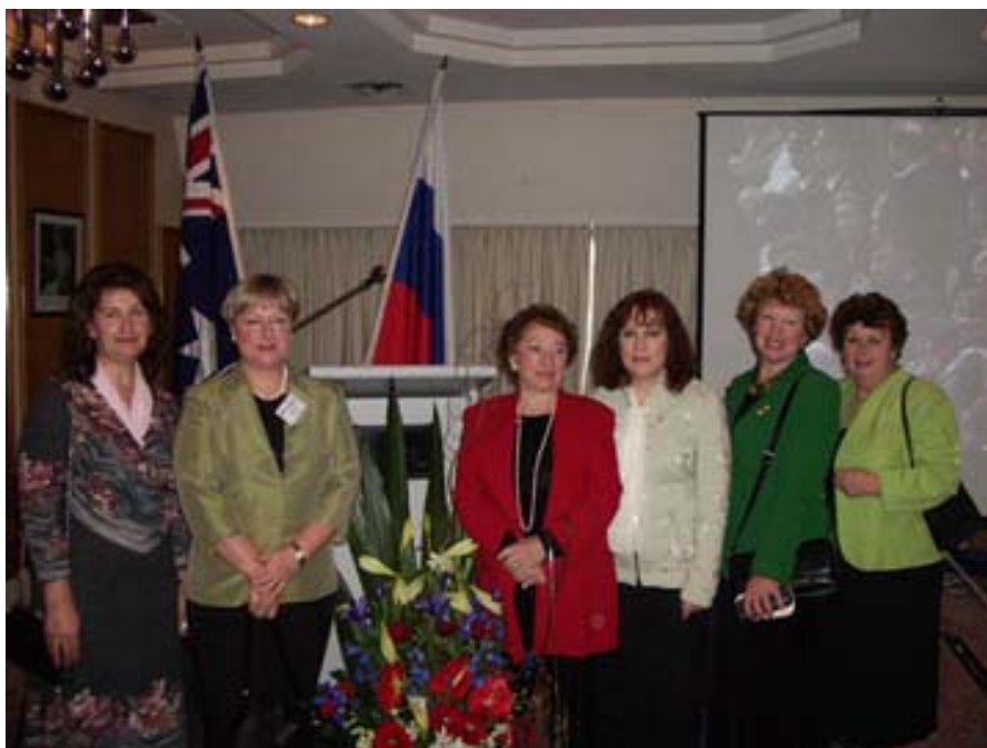
Представители Русских Этнических представительств трех штатов Австралии на приеме в День Независимости России.