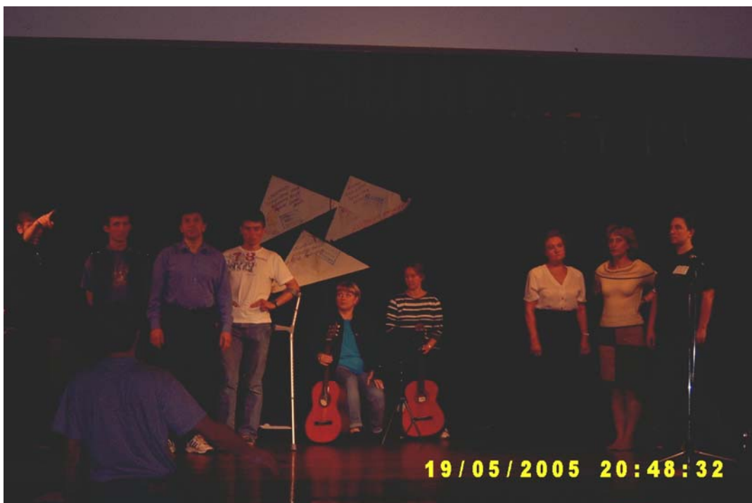
На сцене идет репетиция спектакля "Память, Память"