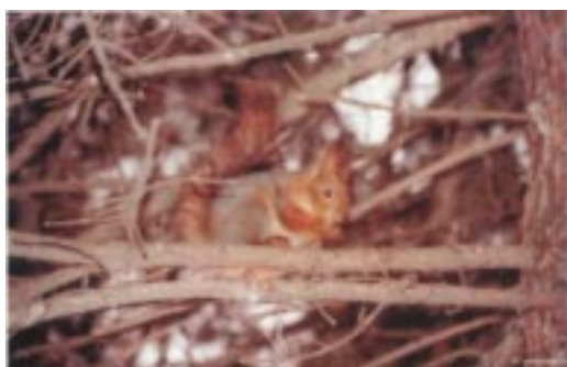
RUSSIA'S MODEL FOREST ON VIEW TO THE WORLD

Программа Образцового Леса, размещаемого на площади 46,000 гектаров, преследует цель создания экологически приемлемой, общественно полезной и экономически жизнеспособной модели управления лесным хозяйством для Псковской области. На сайте www.wwf.ru/pskov имеется дополнительная информация о Псковском Лесе и интересная фото-галерея.